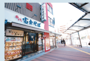
・荻窪駅北口ロータリー