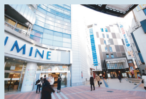
・荻窪駅北口ロルミネ