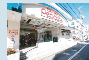
・井荻駅南口ピーコック