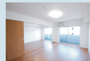
・リビングダイニング