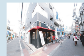
・梅屋敷駅商店街