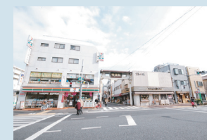
・梅屋敷駅商店街