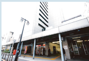
・板橋区役所前駅