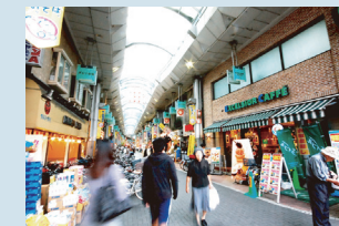
・ハッピーロード大山