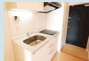
・IH クッキングヒーター