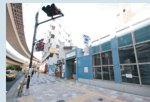
・板橋区役所前駅