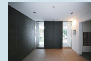
・エクステリアホール